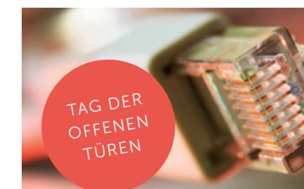
Tag der offenen Türen am 30. November 2013