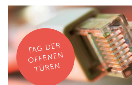
Tag der offenen Türen am 30. November 2013