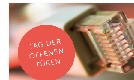
Tag der offenen Türen am 30. November 2013