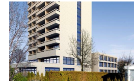
Seniorenzentrum la Vita, Goldach