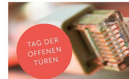
Tag der offenen Türen am 30. November 2013