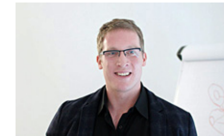
Die Projekt AG ist uns ein zuverlässiger Partner