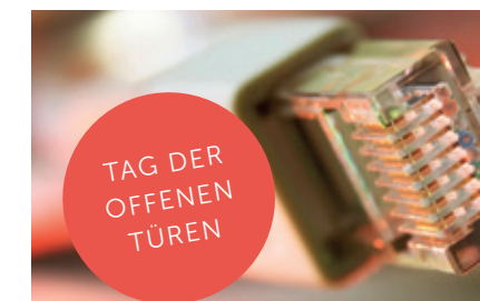
Tag der offenen Türen am 30. November 2013