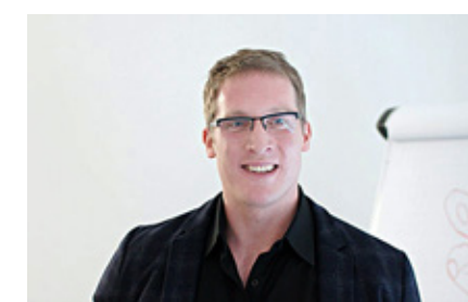
Die Projekt AG ist uns ein zuverlässiger Partner