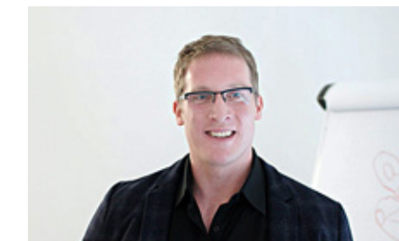
Die Projekt AG ist uns ein zuverlässiger Partner