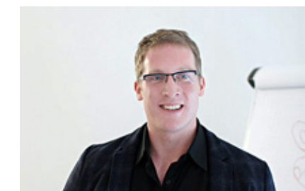
Die Projekt AG ist uns ein zuverlässiger Partner